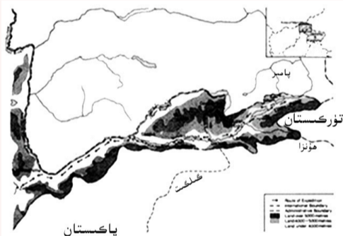
«→» تەكشۈرۈش خادىملىرىنىڭ بېرىش ۋە قايتىش يولىنى، «- -» خەلقئارالىق چېگرانى، «- -» مەمۇرىي رايونلار چېگرىسىنى، قېنىق قارا بويالغان قىسمى دېڭىز يۈزىدىن ئېگىزلىكى 5000 مېتىردىن ئاشىدىغان رايونلارنى، سۇس قارا بويالغان قىسمى دېڭىز يۈزىدىن ئېگىزلىكى 4000-5000 مېتىرغىچە بولغان رايونلارنى كۆرسىتىدۇ.

ئومۇملاشتۇرۇپ ئېيتقاندا، بىز بىر ئايغا سوزۇلغان بۇ قېتىمقى تەكشۈرۈشىمىزدە 300 خىلغا يېقىن ئۆسۈملۈك تۈرىنى بايقىدۇق. ۋاخاندىكى ئۆسۈملۈك تۈرلىرى قوشنا پامىر رايونلىرىدىن بولغان شەرقىي ھىندىقۇش، قارقۇرۇم، غەربىي ھىمالايا ۋە شىمالىي نېپالنىڭ ئوتتۇرا قىسىملىرىدىكى ئۆسۈملۈك تۈرلىرى بىلەن ئوخشاش. بۇ رايونلارنىڭ ھەممىسىنىڭ دېڭىزدەك يامغۇر مىقدارى تۆۋەن بولۇپ، ھىندىستان پەسىللىك يامغۇرنىڭ تەسىرىگە ئۇچرىمايدۇ. قىش پەسىللىرى ئۇزۇن ۋە سوغۇق، ياز پەسىللىرى قىسقا ۋە قۇرغاق. ئېگىزلىكلەردە ئۆسۈملۈكلەرنىڭ ئىنتايىن قىسقىلا ئۆسۈش مەزگىلى بولۇپ، ئۇلار ئاساسەن بىر قانچە ھەپتە ئىچىدە چېچەكلىشى، ئۇرۇقلىنىشى ۋە ئۆسۈشى كېرەك. گەرچە بۇ ئۆسۈملۈكلەرنىڭ بىر قىسمى غەربىي ھىمالاياغا خاس تۈرلەر بولسىمۇ قالغان قىسمى ئوتتۇرا ئاسىيا ۋە شىمالىي قۇتۇب رايونلىرىغا ئالاقىدار تۈرلەردۇر.